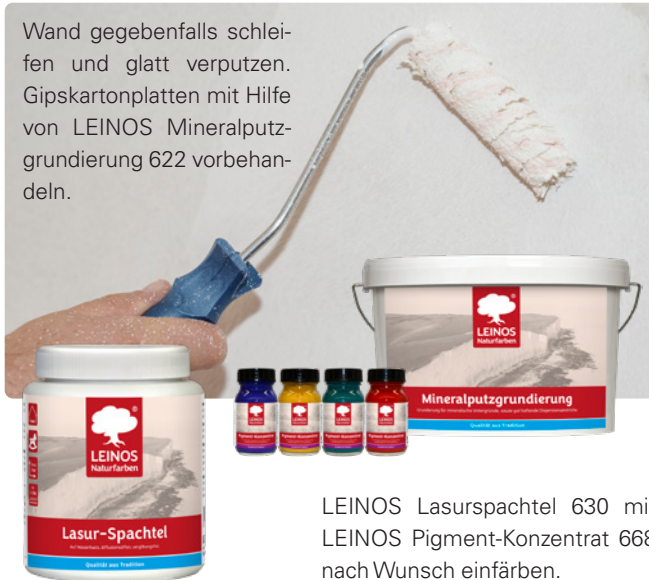
LEINOS Lasurspachtel 630 mit LEINOS Pigment-Konzentrat 668 nach Wunsch einfärben.

Wand gegebenenfalls schleifen und glatt verputzen. Gipskartonplatten mit Hilfe von LEINOS Mineralputzgrundierung 622 vorbehandeln.